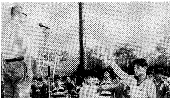
平成2年9月第10回市民大会選手宣誓

藤沢市ラグビーフットボール協会が発足し、はやくも10年が過ぎまして、去る5月25日、藤沢グラウンドホテルに於いて、協会創立10周年の式典を藤沢市体育協会、中山二郎会長をはじめとする多くの来賓の御参列を得まして盛大に開催できましたことをここに感謝申しあげます。 この10年間は、多くの方々の暖かい御支援と御協力のおかげをもちまして、加盟チームも増加してまいりました。その活躍も素晴らしく、県ジュニア大会では、藤沢ラグビースクールが必ず上位の成績を挙げております。中学では、高浜中の第10回東日本中学生大会優勝をはじめとする県、関東大会での活躍、高校の日