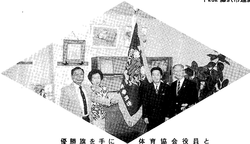
優勝旗を手に 体育協会役員と