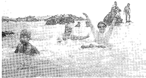
岩場での遊泳を楽しむ子ども達