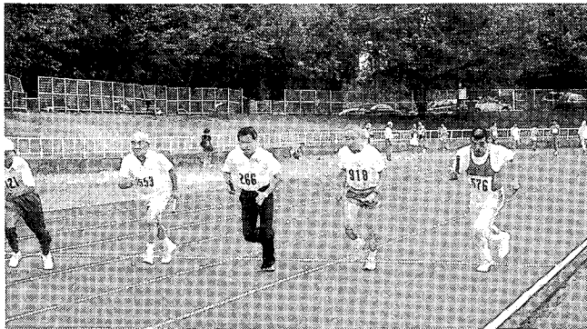
大会の花 混合リレー まずスタートは各地区会長 “がんばって!!”