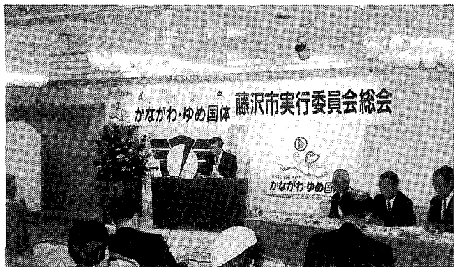
9/18 開催のかながわ・ゆめ国体藤沢市実行委員会

担し、スポーツ関係者や地元市民、行政が一体となって、協議し準備を進め、運営していくところに大きな特色があります。今回の国体も「かながわ・ゆめ国体」の愛称のもと、一流の競技者の集う大会として、質