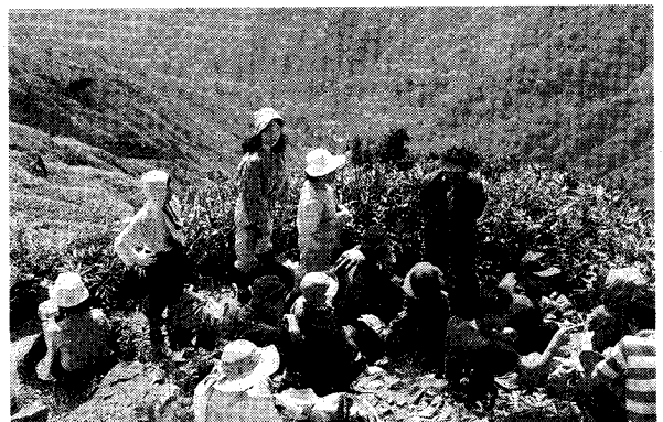
平成7年7月29日 “谷川岳” 藤沢市民登山

私たちの山岳協会は藤沢市体育協会のメンバーとして各種行事に積極的に参加しています。その中でも特筆すべきものとして市民総合体育大会のオープン競技（山岳の部）があります。これはわかり易く述べますと「藤沢市民登山です。」毎年一回ですが年度始めの広報により、藤沢市教育委員会、藤沢市体育協会の主催。主管を藤沢市山岳協会です。一般市