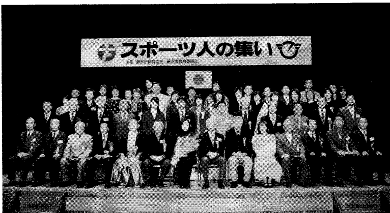
藤沢スポーツ賞のみなさん

スポッライトのあたることのない地道な時間の積み重ねとそれを継続する自分との戦いが素直に感じられる。しかしそうした舞台裏があつてこそ、より一層感慨深い思いをもって臨んだであろう大舞台の数々を「楽しい競技人生だった」と語る柔らかな語り口に共感を覚えると共に、会場の多くの若者にさらなる目標が定まったであろうと想像する。 第三部レセプション会場では、森講師、各受賞者、来賓の方々と交えて、盛会裏に交歓会が行われた。