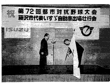
市長から応援旗を受けるいすゞチーム