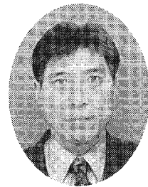
藤沢市教育委員会 生涯学習部長