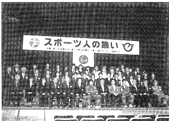
喜びの受賞者のみなさん 於 市民会館小ホール