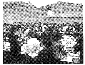
レセプション会場にて

藤沢市のスポーツ界の立て役者である多勢の関係者が一堂に会し会場は超満員となり、大いに親睦の輪が広がりました。